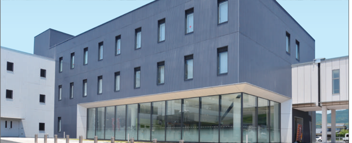
表紙/「全ての工事を終えた長門記念病院の全景」/ 3月に完成した中継棟