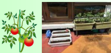
約1カ月後 順調に成長中