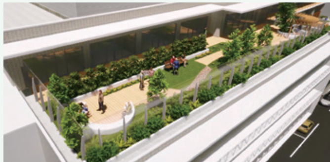
「静」の場となる屋上庭園