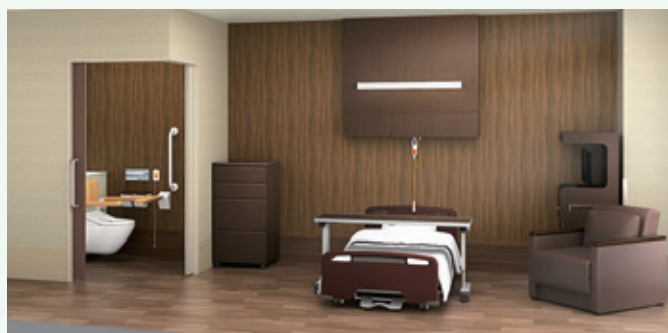
コンソールを隠したホテルのような内装の個室