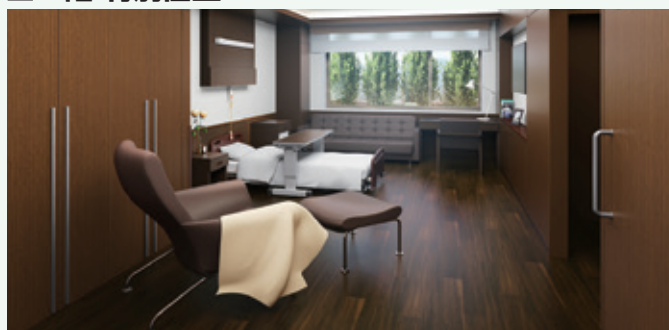
温もりと格調ある空間の特別個室