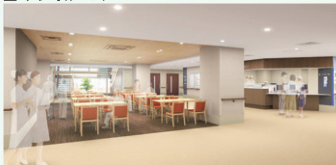
リハビリの場となる3階プレイルーム