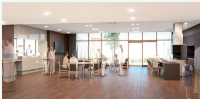
5階デイルームは落ち着いた空間