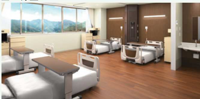
ウォールナット調の落ち着いた色合いの病室