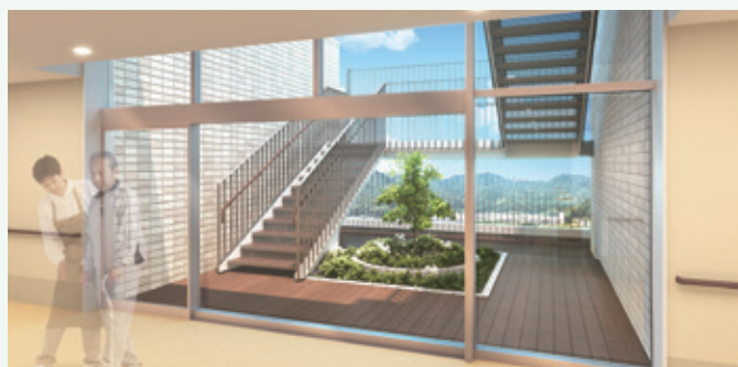
4階庭園へ至る眺望の良いリハビリ階段