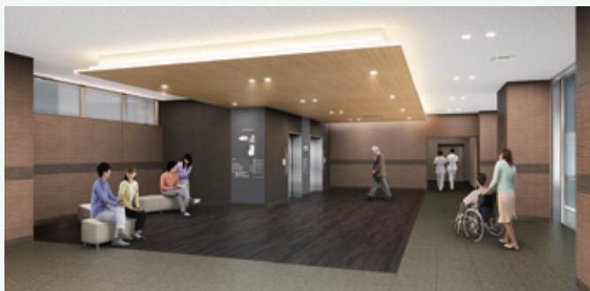
シックな木調材によるフォーマルな空間