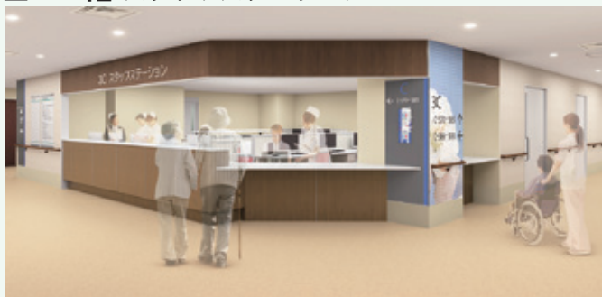
A館と共通のデザインとして判りやすさに配慮