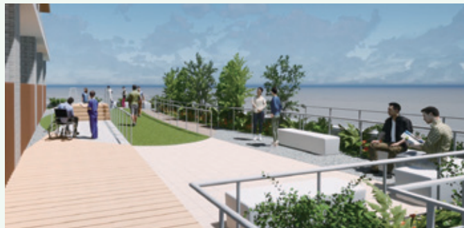
「動」の場となるリハビリ庭園