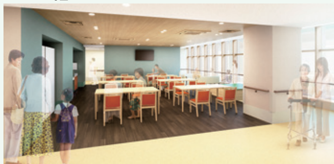
木調材とアース・カラーによる寛ぎの場